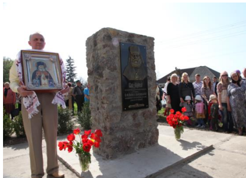
Открытие памятной стеллы Святителю Луке в с.Деньги Черкасской области 27 апреля 2012 года