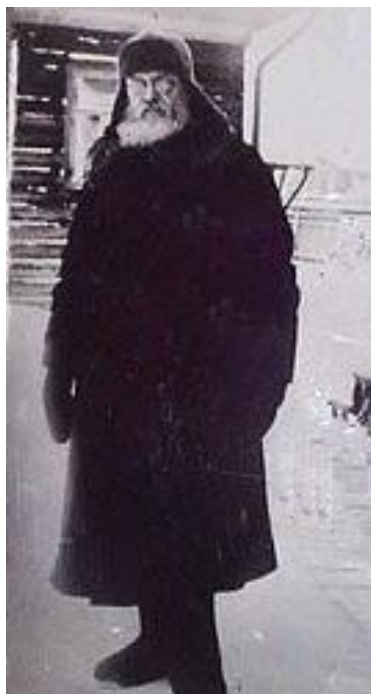
В ссылке в Сибири