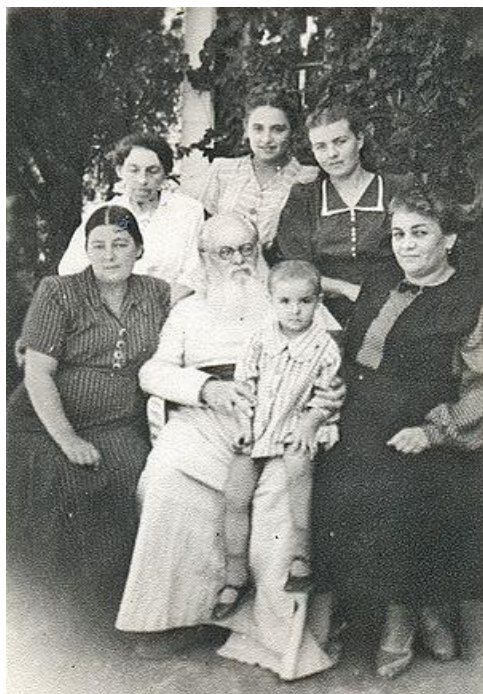
В кругу родных