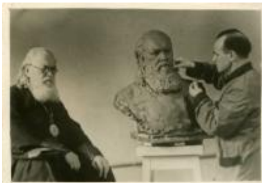
Бронзовой бюст Лауреата Сталинской премии В.Ф. Войно-Ясенецкого был прижизненно установлен в галереи известных хирургов Советского Союза в Москве.